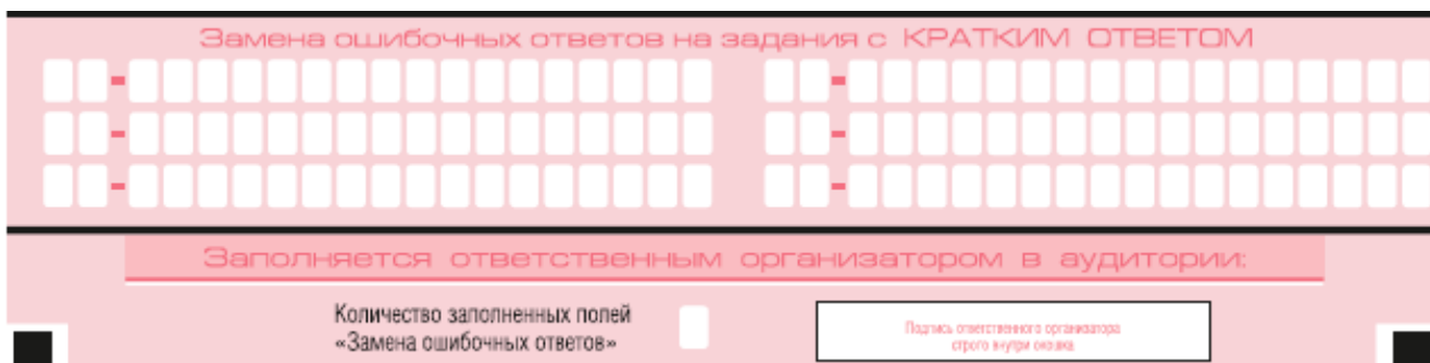
Рис. 9. Область замены ошибочных ответов на задания с кратким ответом

Запрещается записывать ответ в виде математического выражения или формулы. В ответе не указываются названия единиц измерения (градусы, проценты, метры, тонны и т.д.) – так как они не будут учитываться при оценивании. Недопустимы заголовки или комментарии к ответу.